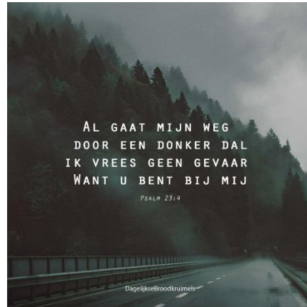
Figuur 8: God is bij mij in het donker