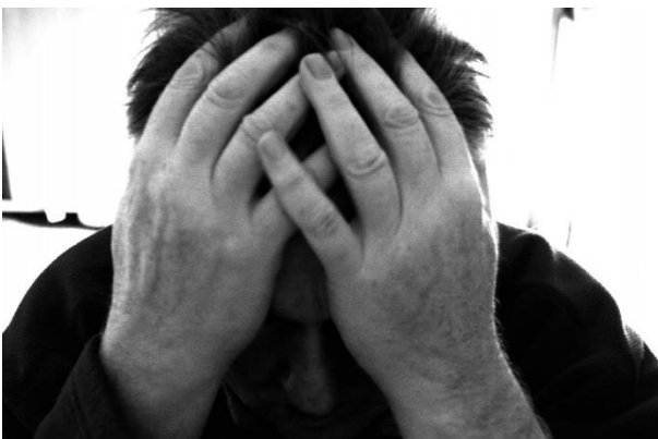
Figuur 5: Verdrietig zijn, alleen voelen