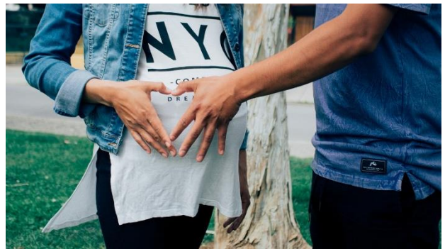
Figuur 13: wachten, uitzien naar...