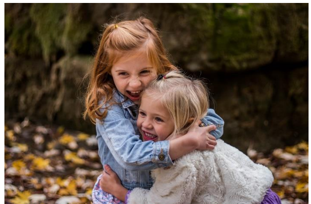
Figuur 11: uitzien naar omhelzing