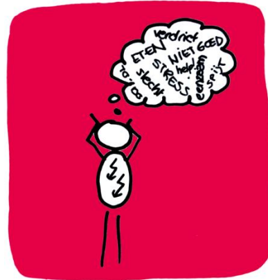
Figuur 2: Onrust