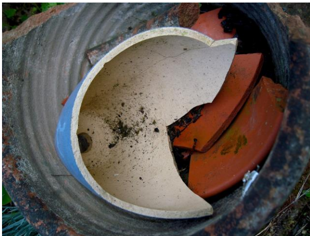
Figuur 14: kwetsbaar als de scherven van een pot