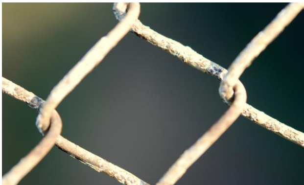
Figuur 3: Hek, geen doorgang