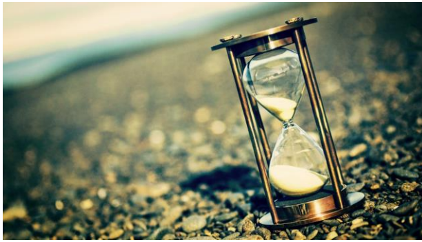
Figuur 12: de tijd gaat langzaam