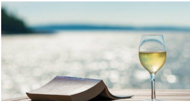
Figuur 9: Genieten van het leven

Leef je leven. Niet gisteren, niet morgen, niet maar even. Zing liedjes op straat. Dans iedere dag. Dan geniet de wereld, op haar beurt, van jouw mooie lach.