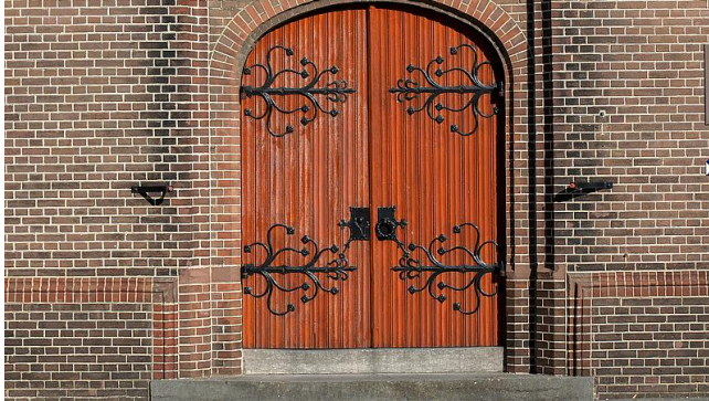
Figuur 1: Kerkdeuren dicht, gesloten