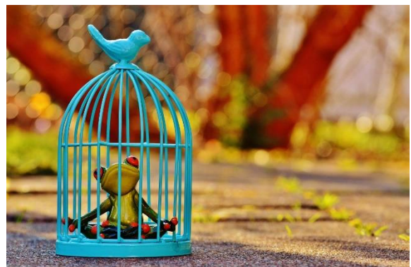
Figuur 4: gevangen als in een kooi