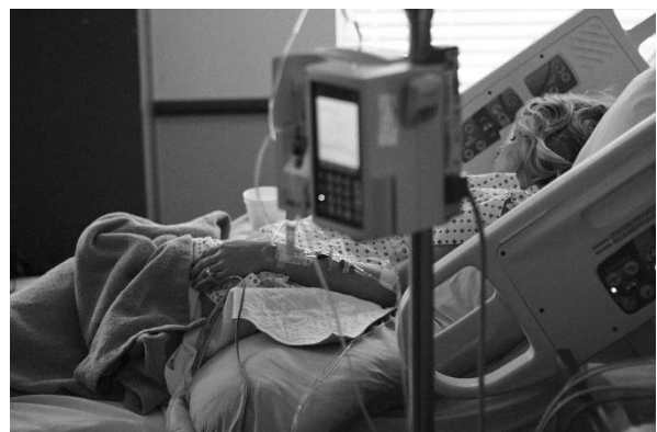
Figuur 6: ziek zijn/ afhankelijk zijn