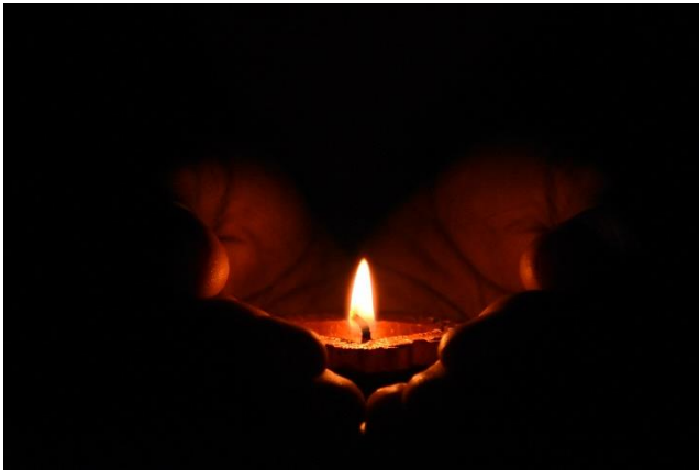
Figuur 7: Licht in het donker